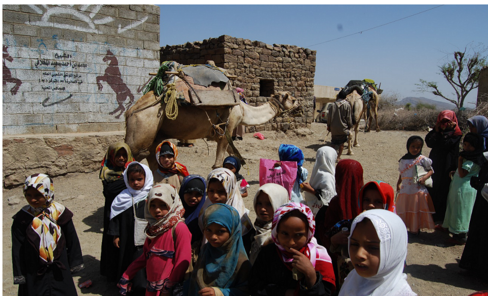
Stiftung Jemenhilfe Deutschland Hilfe die ankommt und unmittelbar wirkt

Seit dem 14.10.2009 ist die „Stiftung Jemenhilfe Deutschland“ beim Finanzamt Augsburg Land als unselbstständige Stiftung amtlich eingetragen. Zustiftungen sind jederzeit möglich. Die Stiftung ist vom Finanzamt Augsburg Land als gemeinnützig im Sinne der Entwicklungshilfe anerkannt und damit berechtigt, Spendenquittungen auszustellen. Die „Stiftung Jemenhilfe Deutschland“ unterstützt die Projekte des „Förderverein Aktion Jemenhilfe e.V.“ und der „Jemen Kinderhilfe e.V.“. Sie sichert damit deren Zukunft. Sämtliche Erträge aus jeglicher Zustiftung, seien es Geldbeträge oder Immobilien, gehen zu gleichen Teilen an die Projekte beider Vereine.